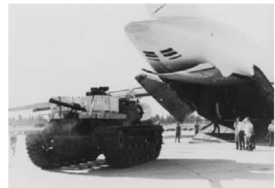
Behalve Nederland kregen ook de Verenigde Staten een olie-embargo opgelegd door de Arabische landen vanwege de hulp aan Israël. Op deze foto is te zien hoe een Amerikaans vliegtuig voorraden verschaft aan een Israëliëse pantserwagen.

De Arabische leiders hebben altijd gezegd dat de belangrijkste reden voor de olieboycot de militaire en politieke steun van Nederland aan Israël was, maar eigenlijk speelden er ook nog andere zaken mee. Een olie-embargo tegen Nederland zou gevolgen hebben voor heel West-Europa. Rotterdam had namelijk een zeer belangrijke doorvoerfunctie in het West-Europese systeem van de verwerking en distributie van olie. Bovendien is Nederland het thuisland van de grote oliemultinational Shell .