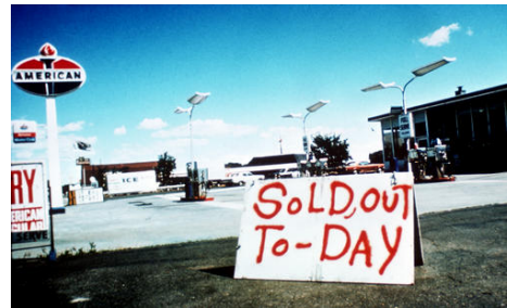
Tankstation in de VS tijdens de oliecrisis van 1973

zondagen en benzinebonnen. De angst bleek uiteindelijk grotendeels ongegrond te zijn, want de gevolgen van de oliecrisis vielen erg mee voor Nederland. De aanvoer van olie kwam al snel weer op gang doordat de grote Westerse oliemaatschappijen met elkaar afspraken de olieaanvoer te herverdelen. Shell speelde hierbij een zeer grote rol voor Nederland.