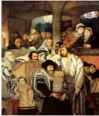
Afbeelding van Jom Kipoer, de Joodse Grote Verzoendag. De Jom Kipoeroorlog begon in 1973 op deze feestdag.

In de jaren zeventig werd de energiemarkt gekenmerkt door onrust. Dit kwam vooral door de twee grote oliecrises in 1973 en in 1979.