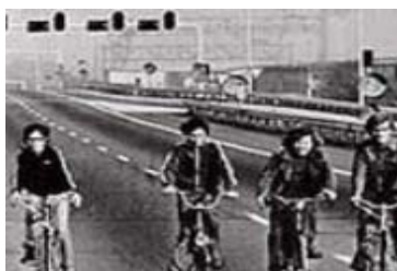
Autoloze zondag in 1973: fietsen op de snelweg

Als gevolg van het olie-embargo ontstond er een sombere en negatieve stemming in Nederland. Het embargo werd door de politiek afgeschilderd als een nationale ramp. Er werd voorspeld dat de werkloosheid zou stijgen en de economische groei zou dalen. Het kabinet stelde beruchte maatregelen in als autoloze