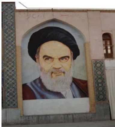
Ayatollah Khomeini was een van de sleutelfiguren in de Iraanse revolutie, die leidde tot de verbanning van de sjah.

In 1979 zorgde onrust in het Midden-Oosten wederom voor een crisis op de energiemarkt. In Iran was de op het Westen georiënteerde sjah het land uit gejaagd en van de ene op de andere dag lag de olie-export stil. Iran was in die tijd, na Saoedi-Arabië, de grootste olieleverancier. De olieprijs schoten omhoog. De oorlog die het jaar daarna uitbrak tussen Iran en Irak zorgde ervoor dat de situatie op de oliemarkt verder verslechterde. In 1981 bereikten de olieprijs een recordhoogte.