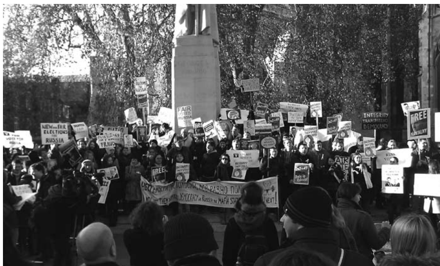
Russen demonstreerden tegen de vermeende fraude tijdens de Doemaverkiezingen

Doemaverkiezingen van begin december niet eerlijk is verlopen. De fraude was in het voordeel van de regerende partij Verenigd Rusland. Zij houdt met 238 van de 450 zetels de meerderheid in de Doema. Toch is het verlies van 77 zetels een gevoelige tik en lijkt de populariteit van Vladimir Poetin tanende. Steeds luider klinken de protestgeluiden in Moskou.