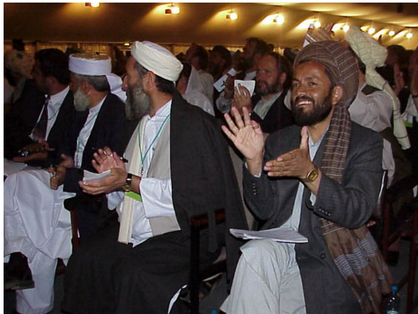
De Loya Jirga in vergadering.

Op 11 augustus 2003 nam de NAVO het commando over ISAF over van de Verenigde Naties. De overname was een historische gebeurtenis in de geschiedenis van de Noord-Atlantische Verdragsorganisatie, omdat dit de eerste militaire operatie buiten Europa was. In oktober van hetzelfde jaar werd besloten de missie verder uit te breiden om zo het toegenomen geweld het hoofd te kunnen bieden. Twee jaar na het omverwerpen van de Taliban werd de definitieve tekst voor de nieuwe grondwet goedgekeurd. De Loya Jirga (Grote Vergadering), een orgaan waarin alle etnische en religieuze groeperingen van het land vertegenwoordigd zijn, keurde de definitieve tekst unaniem goed. Vervolgens konden er verkiezingen uitgeschreven worden.