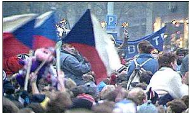
Betogers in Tsjecho-Slowakije

In Polen werd de tot dan toe verboden vakbond Solidarnosc (Solidariteit) in april 1988 gelegaliseerd na massale stakingen. Bij de verkiezingen in juni won de vakbond bijna alle zetels van het Poolse parlement. Overal in het Oostblok ontstonden betogingen en opstanden tegen de regeringen. Deze vroegen de Sovjetunie om hulp, maar Gorbatsjov weigerde in te grijpen.