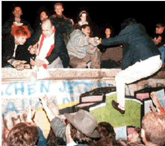
De val van de Berlijnse Muur: duizenden mensen klimmen over en op de muur en beginnen de muur te slopen.

Uiteindelijk moesten de communistische leiders aftreden en werden geleidelijk de democratie en de vrije markteconomie ingevoerd. Opvallend genoeg vond deze machtswisseling vrijwel overal geweldloos plaats. Symbolisch voor de ondergang van het communisme was de val van de Berlijnse Muur in november 1989. Op 3 oktober 1990 werden Oost- en West-Duitsland herenigd.