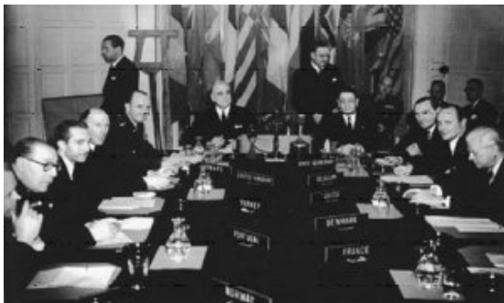
De oprichters van de NAVO in 1949

Algauw bleek dat de Sovjetunie daar anders over dacht. De West-Europese landen en de VS raakten bezorgd over de opmars van het communisme in Europa en het militaire overwicht van de Sovjetunie. Daarom besloten zij in 1949 tot de oprichting van een collectieve veiligheidsorganisatie: de Noord-Atlantische Verdragsorganisatie (NAVO).