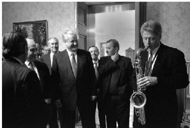
Bill Clinton speelt saxofoon tijdens een bezoek aan Boris Jeltsin.

voor een groot deel toegeschreven worden aan de goede contacten tussen de toenmalige Amerikaanse president Bill Clinton en de Russische leider Boris Jeltsin .