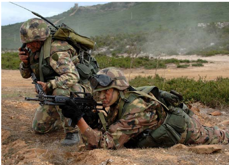
Regelmatig voeren de NAVO-lidstaten oefeningen uit met partnerlanden

Maak een overzicht van de landen die op dit moment deelnemen aan het Partnerschap voor de Vrede.