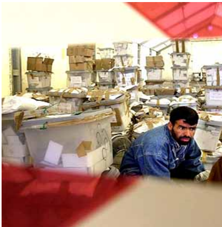
Stemmen in Irak

Op 16 oktober 2003 werd door de VN-veiligheidsraad unaniem een resolutie aangenomen over de wederopbouw van Irak. Volgens de resolutie zou er een nieuwe nationale krijgsmacht worden samengesteld. Daarnaast diende de huidige Irakese regering een tijdschema te presenteren voor de totstandkoming van een grondwet en het houden van vrije verkiezingen. De situatie in Irak verslechterde echter, getuige de voortdurende bomaanslagen in met name Bagdad. Op 28 juni 2004 droeg het tijdelijke coalitiebestuur onder leiding van de Amerikaan Paul Bremer het gezag over aan een soevereine Irakese interim-regering.