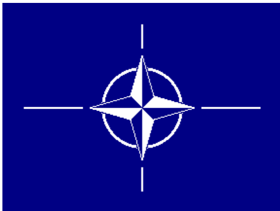
De vlag van de NAVO