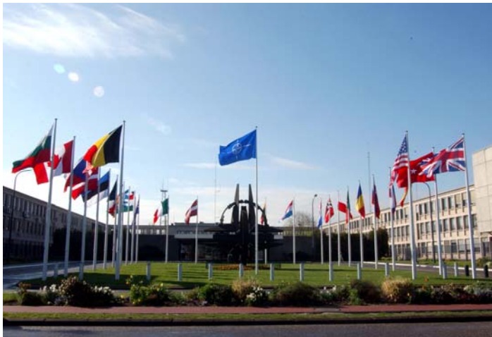
Navo-hoofdkwartier in Brussel

De veranderde veiligheidssituatie had ook militair grote gevolgen. De NAVO-landen hadden tijdens de Koude Oorlog talloze zware tankeenheden opgesteld om een massale Russische aanval te kunnen beantwoorden. De lidstaten onderhielden omvangrijke, logge legers van dienstplichtige soldaten. Na de veranderingen in de Europese en wereldwijde veiligheidssituatie besloten de NAVO-landen zich te richten op het bevorderen van de veiligheid en stabiliteit binnen en buiten Europa. De krijgsmachten van de lidstaten moesten drastisch