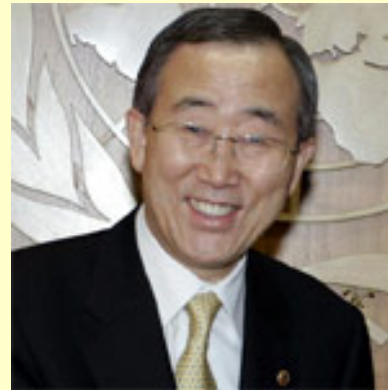
Ban Ki-moon

Naast de Veiligheidsraad en de Algemene Vergadering kennen de VN een Secretariaat . Dit bestaat uit de internationale staf en draagt zorg voor de dagelijkse gang van zaken bij de Organisatie. Het Secretariaat wordt geleid door de secretaris-generaal , die het 'gezicht' van de VN is. Vanaf 2007 is dat Ban Ki-moon uit Zuid-Korea.