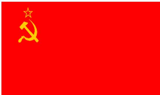
Vlag van de Sovjetunie

De omwentelingen in Oost-Europa in 1989 luidden het einde van de Koude Oorlog in. Decennialang hadden Oost en West tegenover elkaar gestaan en dreigde het op sommige momenten tot een gewapend treffen te komen. De landen van Centraal- en Oost-Europa (ook wel de Oostbloklanden genoemd) waren sinds 1955 lid van het Warschaupact , de communistische tegenhanger