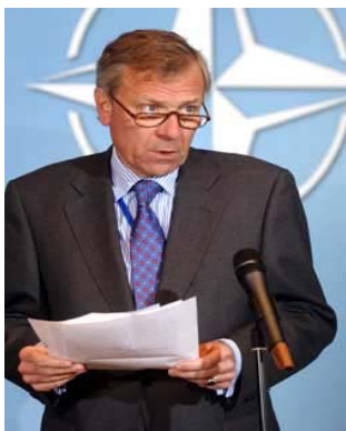
Jaap de Hoop Scheffer

De Noord-Atlantische Raad (NAR) is het hoogste besluitvormingsorgaan van de NAVO. Alle lidstaten hebben via hun ambassadeur, de Permanente Vertegenwoordiger, zitting in de Raad. De Raad heeft de politieke leiding over het bondgenootschap. De Permanente Vertegenwoordigers komen minstens één keer per week een bijeen op het hoofdkwartier in Brussel. De voorzitter van de NAR is de secretaris-generaal van de NAVO . De Noord-Atlantische Raad is een uniek orgaan, omdat het de enige plek is waar Amerikanen en Europeanen elkaar met grote regelmaat ontmoeten en problemen kunnen bespreken.