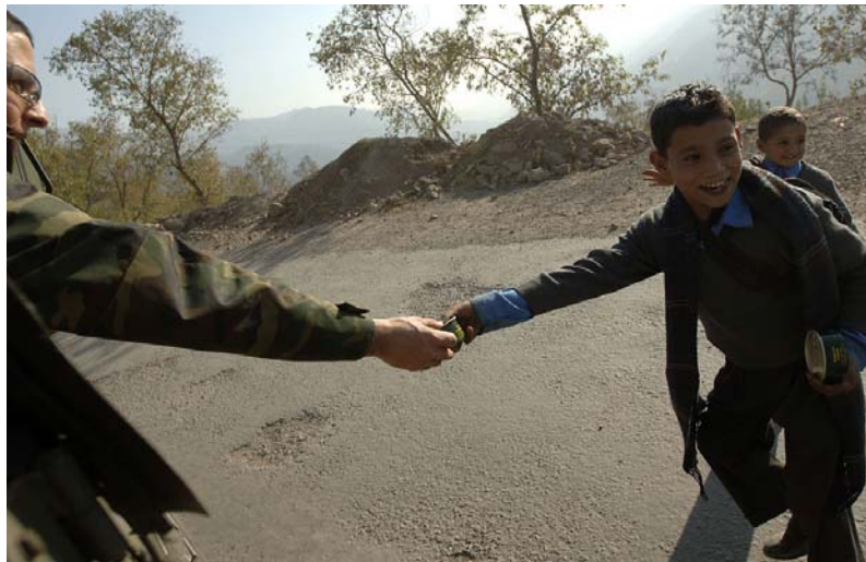
Een NAVO-militair schudt de hand van een Pakistaanse jongen.

De NAVO voerde een humanitaire missie uit na de aardbeving in Kashmir (2005).