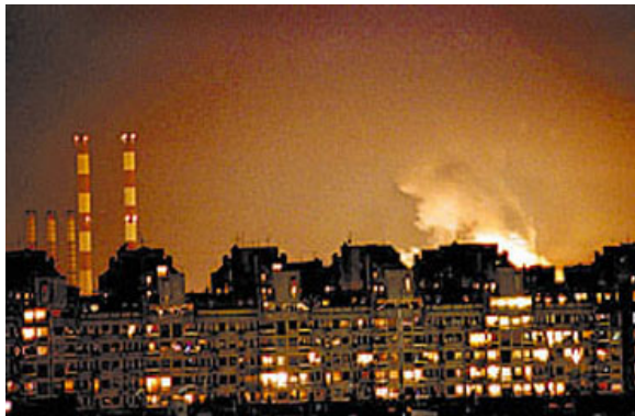
Bomaanvallen op Belgrado

Het Westen vond dat het niet langs de zijlijn kon blijven toekijken. Het stelde Milosevic een ultimatum: hij moest zijn offensief stoppen en overleg gaan voeren over de toekomst van Kosovo, of zijn daden zouden vérgaande gevolgen krijgen. In eerste instantie leek de Westerse dreiging effect te hebben, maar begin '99 voerde Milosevic zijn offensief in de provincie weer op. Kort daarvoor waren onderhandelingen onder Frans-Britse leiding in Rambouillet mislukt. De bedoeling was om Kosovo een zekere autonomie binnen Servië te geven en een internationale vredesmacht onder leiding van de NAVO te stationeren in het gebied. Ook NAVO-topfunctionarissen onderhandelden hierover met president Milosevic. De Servische president accepteerde het voorstel echter niet. Toen was