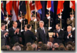
De Amerikaanse president Bill Clinton schudt handen met Viktor Orbán, de minister-president van Hongarije (1999)